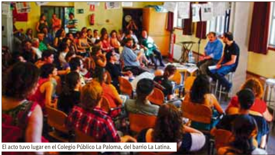
El acto tuvo lugar en el Colegio Público La Paloma, del barrio La Latina.

El pasado 17 de junio tuvo lugar una jornada de reflexión, conocimiento y crítica sobre los medios de comunicación y el papel del periodismo, en el Colegio Público La Paloma, del barrio La Latina: Cómete el periodismo .