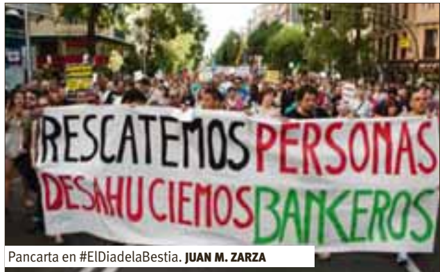
Pancarta en #ElDiadelBestia. JUAN M. ZARZA