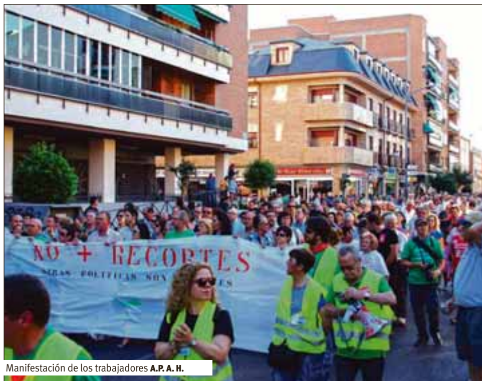
Manifestación de los trabajadores A.P.A.H.

Alcalá de Henares, 25 de junio de 2012.- Personas trabajadoras, estudiantes y vecinos de Alcalá de Henares (y del resto del Corredor) se han unido en este último mes en defensa de una educación y una sanidad gratuitas, comunes y universales.