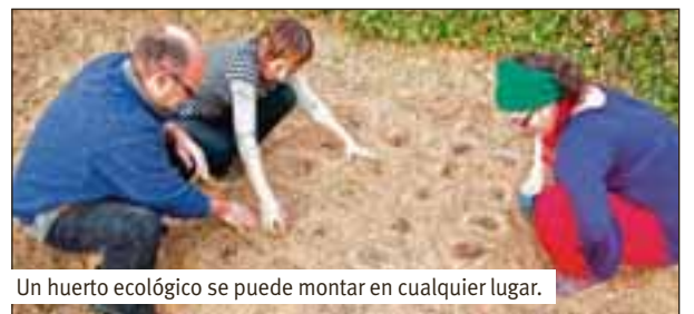
Un huerto ecológico se puede montar en cualquier lugar.