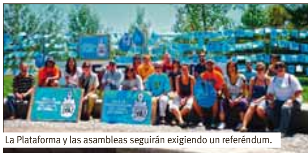
La Plataforma y las asambleas seguirán exigiendo un referéndum.

En las 16.500 cuartillas y carteles azules que han decorado las calles de Madrid este domingo, se pueden leer frases como: «El agua del canal no es para Espe.ular», «El agua es vida», «Los derechos no se venden, ¡agua pública ya!», o «¿Qué será lo siguiente? ¿El aire? ¿Qué miedo!», «Somos 70 agua, ¿a nosotros también nos privatizarán?» y un largo etcétera.