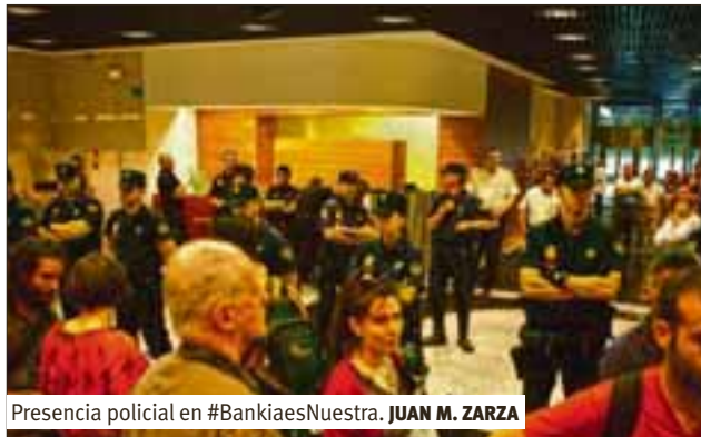
Presencia policial en #BankiaesNuestra. JUAN M. ZARZA