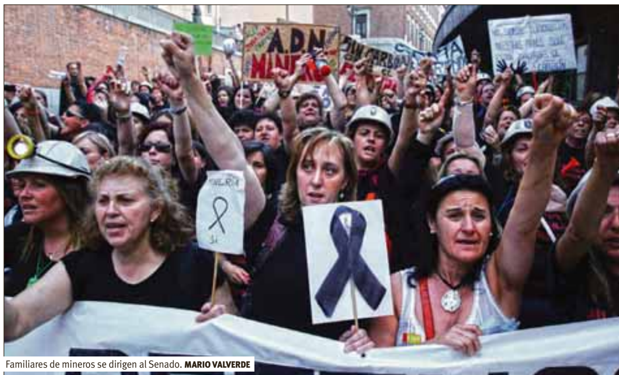
Familiares de mineros se dirigen al Senado. MARIO VALVERDE