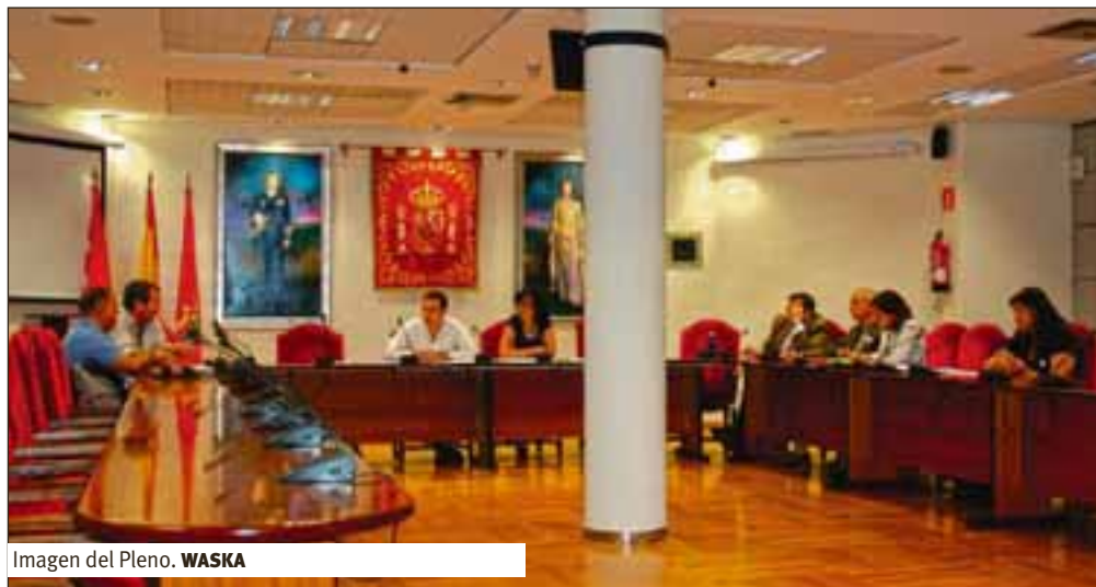
Imagen del Pleno. WASKA

Getafe, 9 de septiembre de 2011. Los diferentes grupos parlamentarios se reúnen en el Ayuntamiento, comienza la sesión ordinaria del Pleno. Uno de los grupos municipales, IU-Los Verdes, presenta a los asistentes una propuesta en referencia a las familias en situación de embargo de su vivienda. Se somete a votación y se aprueba por unanimidad de los grupos parlamentarios municipales.