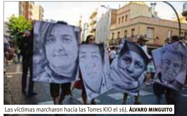
Las víctimas marcharon hacia las Torres KIO el 16J. ÁLVARO MINGUITO

A raíz de las actividades organizadas en la plaza temática de vivienda durante el 12M15M surgió la idea de lanzar una campaña de acciones contra Bankia, durante el mes de junio. Como punta de lanza del proyecto, dirigido a señalar a los culpables de la estafa bancaria, elegimos Bankia por su especial responsabilidad en la problemática de la vivienda y la deuda. Hemos de recordar que esta entidad ejecuta más del setenta por ciento de los desahucios de Madrid, es la mayor inmobiliaria del país y mantiene centenares de miles de viviendas abandonadas a la especulación.