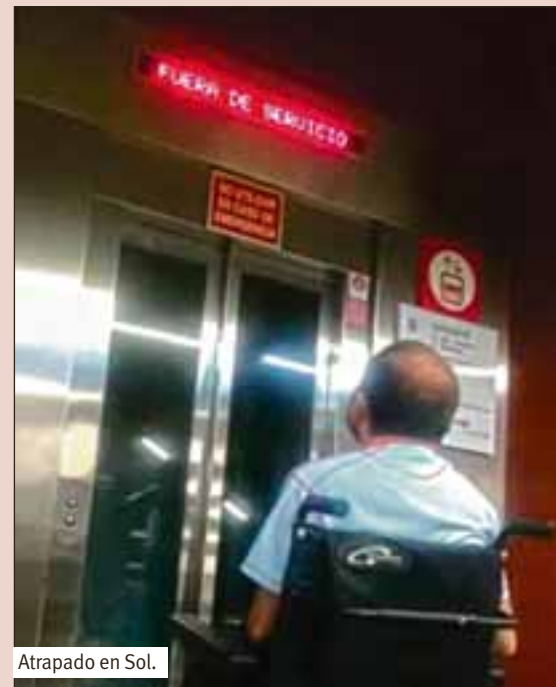
Atrapado en Sol.

La acción tiene un planteamiento colaborativo por varios motivos: porque cree-