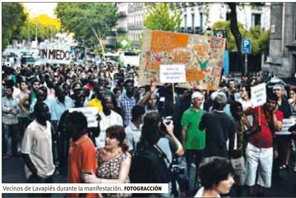
Vecinos de Lavapiés durante la manifestación. FOTOGRAFACIÓN

El domingo 27 de mayo varios policías municipales de paisano abordaron a un grupo de vecinos de Lavapiés de origen africano que se ganaban la vida vendiendo gafas, cedés, etc., en Tirso de Molina. Éstos, al ver que los policías iban, una vez más, a robarles su mercancía, echaron a correr y entraron en el portal de la calle Amparo 10 para dejar allí sus mantas y descansar. Los agentes los persiguieron, entraron a la fuerza en el edificio y empezaron a golpear las puertas de las viviendas, mientras ellos escapaban subiendo por las escaleras. Un vecino de ese edificio, también de origen africano, nos explicó que, al abrir la puerta de su casa, los policías se metieron dentro, lo amenazaron y lo identificaron, mientras él insistía en vano en explicarles que no tenía nada que ver con el asunto.